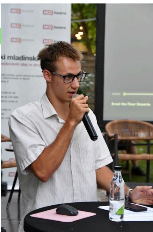
ALJAŽ (SLOWENIEN) – DIE PAUSE Bodeninitiative zur Förderung urbanen Wohnens KULTUR UND TANZTOCELJE