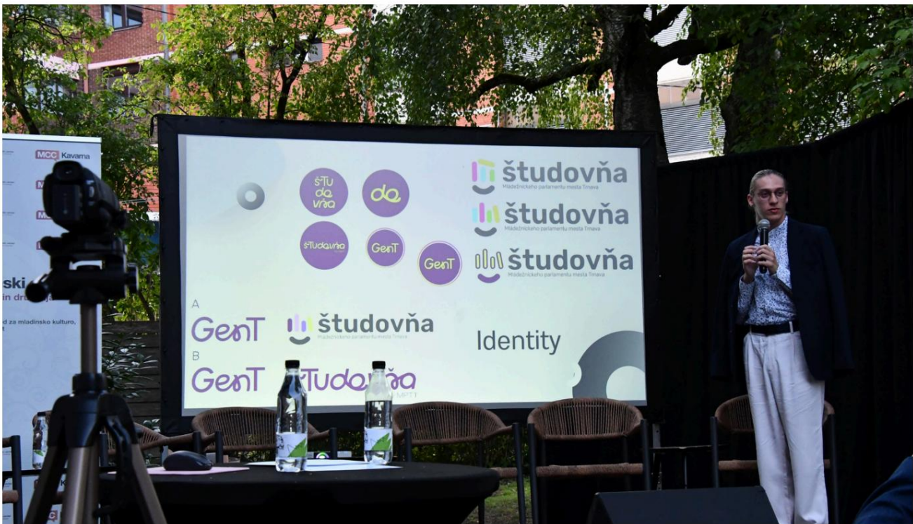
DOMINIK (SLOWAKEI) – GRÜNDUNG EINES STUDENTEN-COWORKING-SPACES